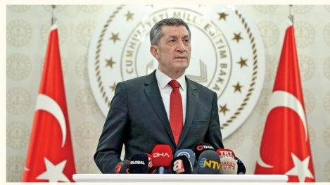
MİLLÎ EĞİTİM BAKANI ZIYA SELÇUK:

Koronavirüs tedbirleri kapsamında, üniversitelerin 16 Mart'tan itibaren 3 hafta tatil ilan edilmesinin ardından YÖK 'ün aldığı tedbirler de belirlendi. Alınan bilgiye göre, üniversitelerdeki bütün koronavirüs tedbirleri, YÖK 'ün koordinasyonunda üniversitelerle sürekli temas halinde yürütülecek. 3 haftalık tatil sürecinin uzatılıp uzatılmayacağına koronavirüsün seyrine göre, ilgili devlet makamlarının değerlendirmesinin ardından karar verilecek. Üniversitelerdeki tatil sürecine konferans, panel, sergi, toplantı, çalıştay, kongre gibi etkinlikler de düzenlenmeyecek. Üniversitelerdeki idari ve akademik personele tatil olmayacak. Koronavirüsün Türkiye'deki seyrine göre bu konu yeniden değerlendirilecek.