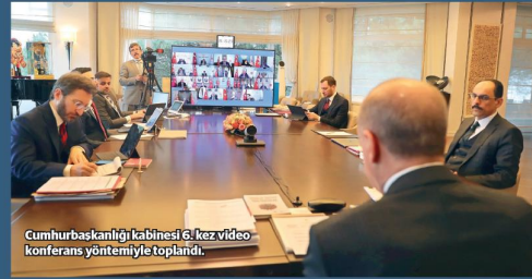
Cumhurbaşkanlığı kabinesi 6. kez video konferans yöntemiyle toplandı.

Her hafta ilerimizde ilgili değerlendirme yapacak, gelişmelere göre karar vereceğiz. Diğer 24 ilimizdeki giriş çıkış sınırlaması 15 gün süreyle uzatılmıştır. İstanbul, Ankara, İzmir'deki ticari taksiler için tek çift plaka uygulamasını 5 Mayıs itibarıyla sona erdiriyoruz. Berber, kuaför, güzellik salonu gibi işletmeler 11 Mayıs'ta faaliyete geçebilecek. Alışveriş merkezleri 11 Mayıs'tan itibaren hizmet vermeye başlayabilecek.