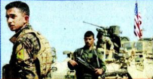
Erdoğan, ABD'nin terör örgütü için güvenli bölge oluşturmanın peşinde olduğunu söylemişti.