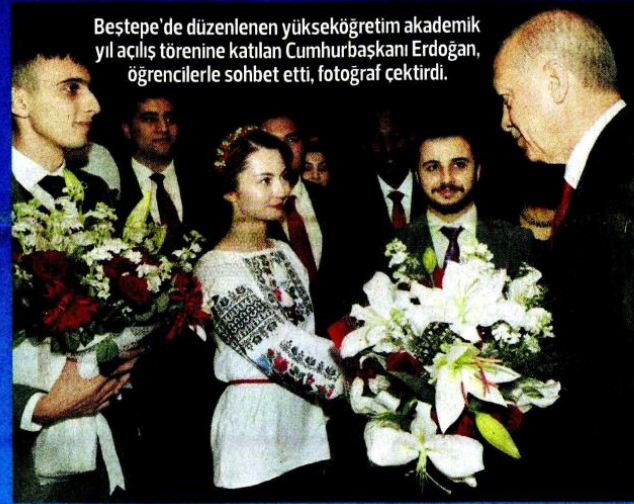
Bestepe'de düzenlenen yükseköğretim akademik yıl açılış törenine katılan Cumhurbaşkanı Erdoğan, öğrencilerle sohbet etti, fotoğraf çekti.

■ Cumhurbaşkanı Erdoğan, ABD ile yürütülen güvenli bölge çalışmalarıyla ilgili olarak bir kez daha uyardı: "İki hafta içinde bir sonuç çıkmazsa hareket planlarımızı devreye sokacağız. Artık laf bizi doyurmuyor, laf ola beri gele yok, icraat bekliyoruz." » Erdiñ ÇELİKKAN » 13'te