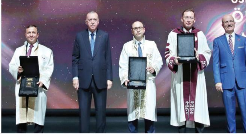
Erdoğan, akademisyenlere 'YÖK 2021 Üstün Başarı Ödülleri'ni verdi.