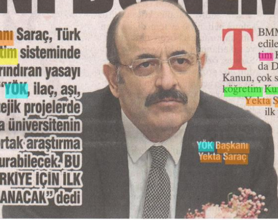
YÖK Başkanı Yekta Saraç

YÖK Başkanı Saraç, Türk yükseköğretim sisteminde ilkleri barındıran yasayı anlattı. Saraç, "YÖK, ilaç, aşı, tohum gibi stratejik projelerde birden fazla üniversitenin katılımıyla ortak araştırma merkezi kurabilecek. BU MODEL, TÜRKİYE İÇİN İLK DEFA UYGULANACAK" dedi